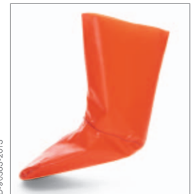
Las botas de seguridad integradas hacen que el equipo sea más fácil de poner.