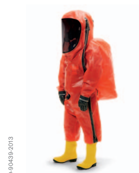
Dräger CPS 6900 con la válvula de control PT 120 L