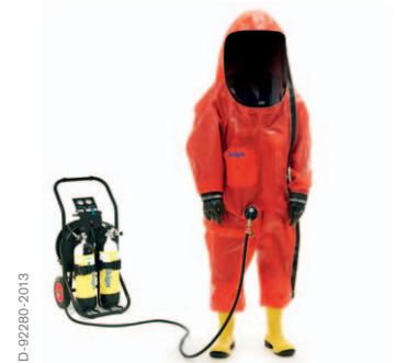
Dräger CPS 6900 con la válvula de control PT 120 L y Dräger PAS AirPack I

El Dräger CPS 6900 garantiza la máxima comodidad incluso durante las tareas de mayor dificultad en zonas peligrosas. El CPS 6900 proporciona libertad de movimiento gracias a su innovador diseño ergonómico disponible en cinco tallas diferentes. Además, el material del traje, ligero y suave, se adapta perfectamente a sus movimientos y ofrece la máxima flexibilidad. Las tiras ajustables ofrecen al usuario mayor comodidad y mejor ajuste.